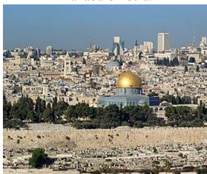
Betlemme e Gerusalemme (luoghi della nascita, passione e risurrezione di Gesù)