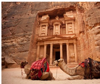
Aman, Jerash, Monte Nebo, Madaba e Petra.

LE ISCRIZIONI SONO APERTE fino al 15 febbraio