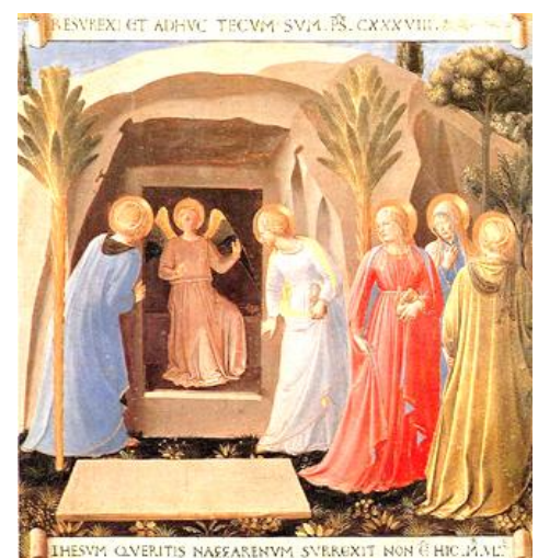
Risurrezione In alto: Arcabas In basso: Beato Angelico

In questi tempi drammatici di guerra e violenza, il nostro augurio è che la Pasqua aiuti tutti noi a credere che ogni giorno possiamo con tante piccole scelte vincere il male con il bene, ridonando splendore a quella immagine di Dio che portiamo impressa nell'anima e che il Nemico cerca invano di cancellare.